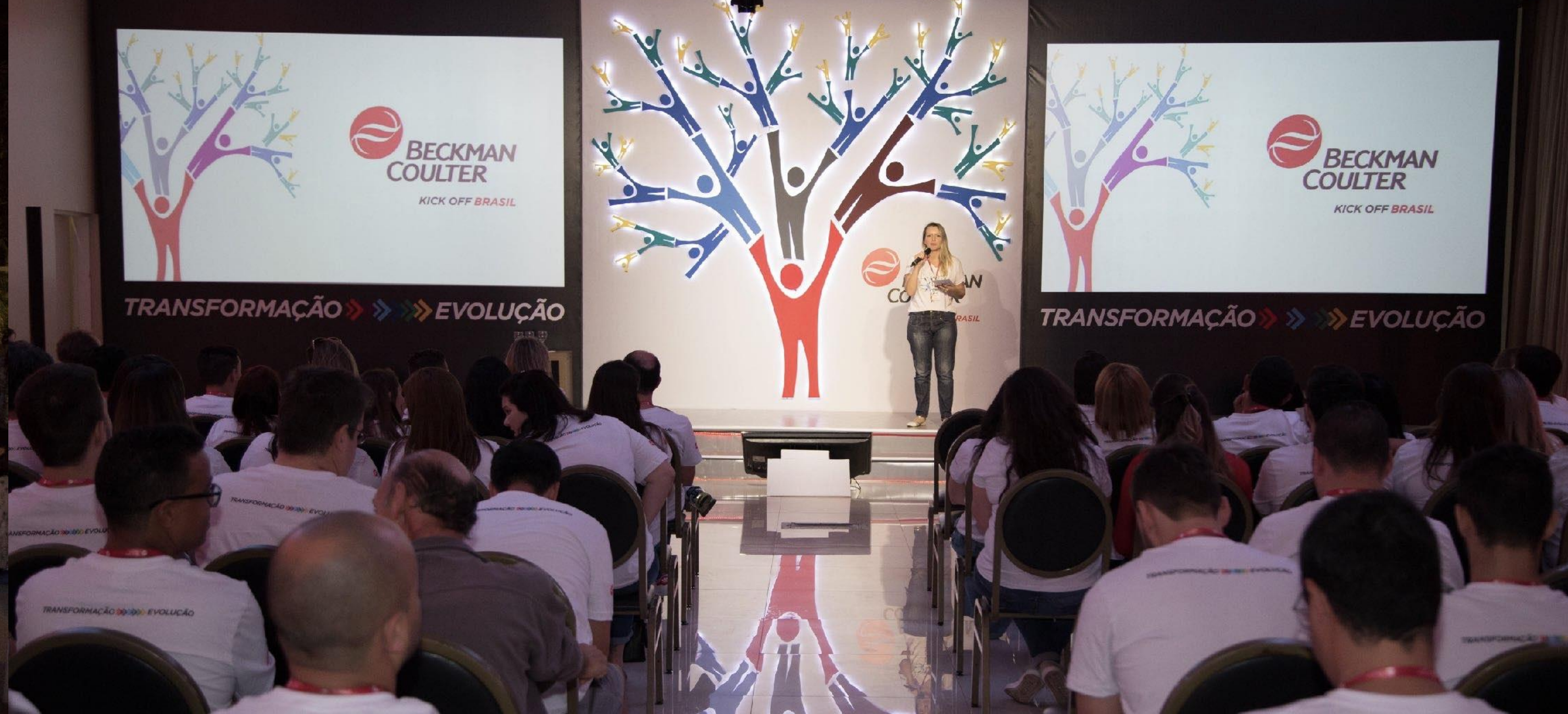
BECKMAN | KICK OFF MEETING BRASIL 2018