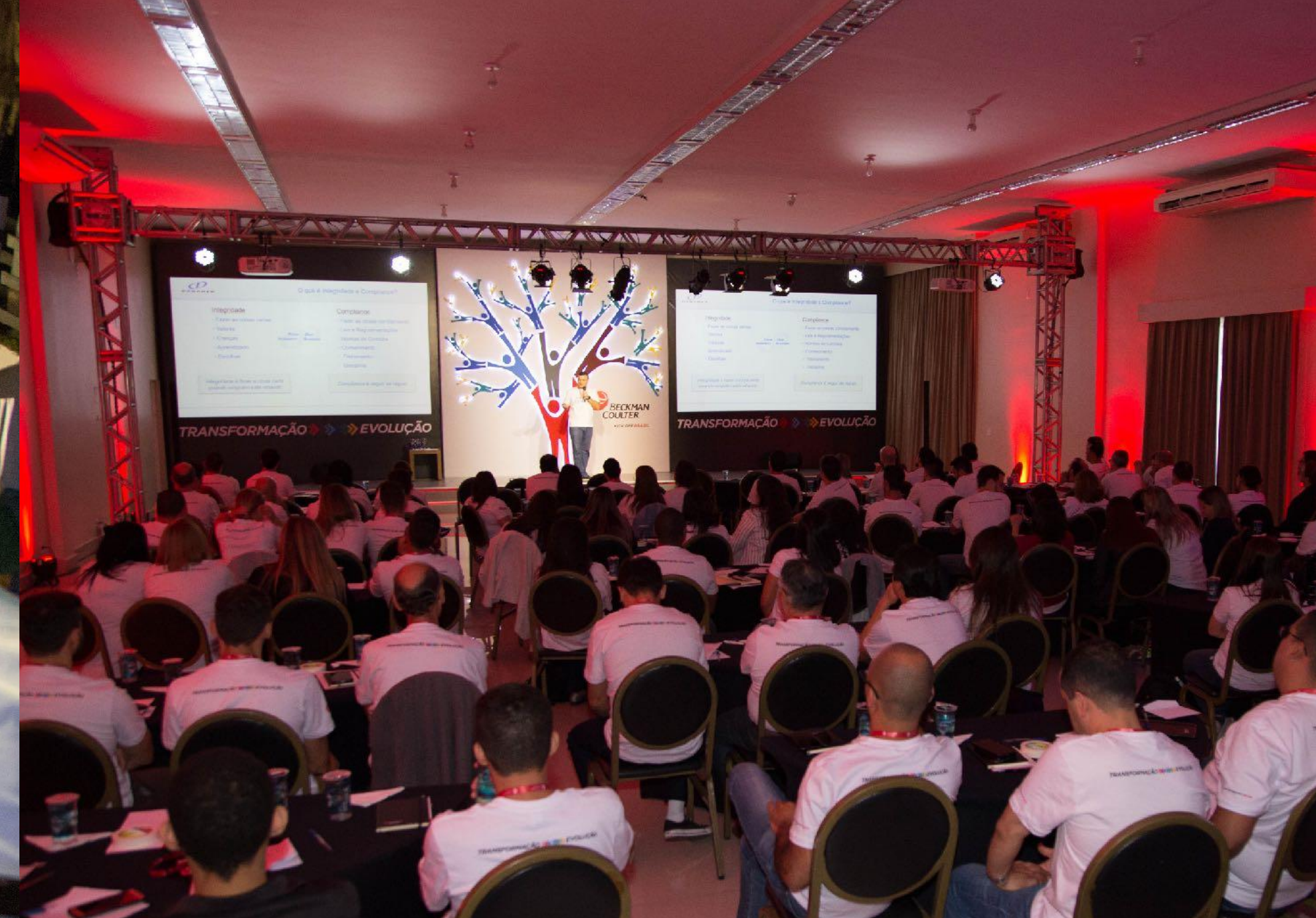
BECKMAN | KICK OFF MEETING BRASIL 2018