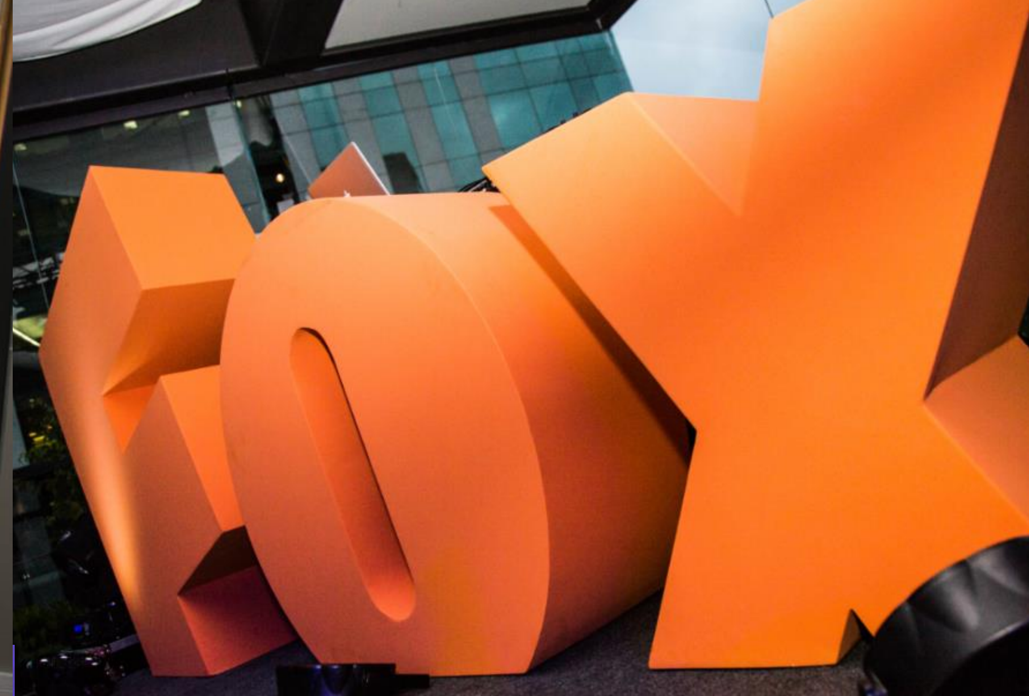
FOX NETWORK | GLOW PARTY