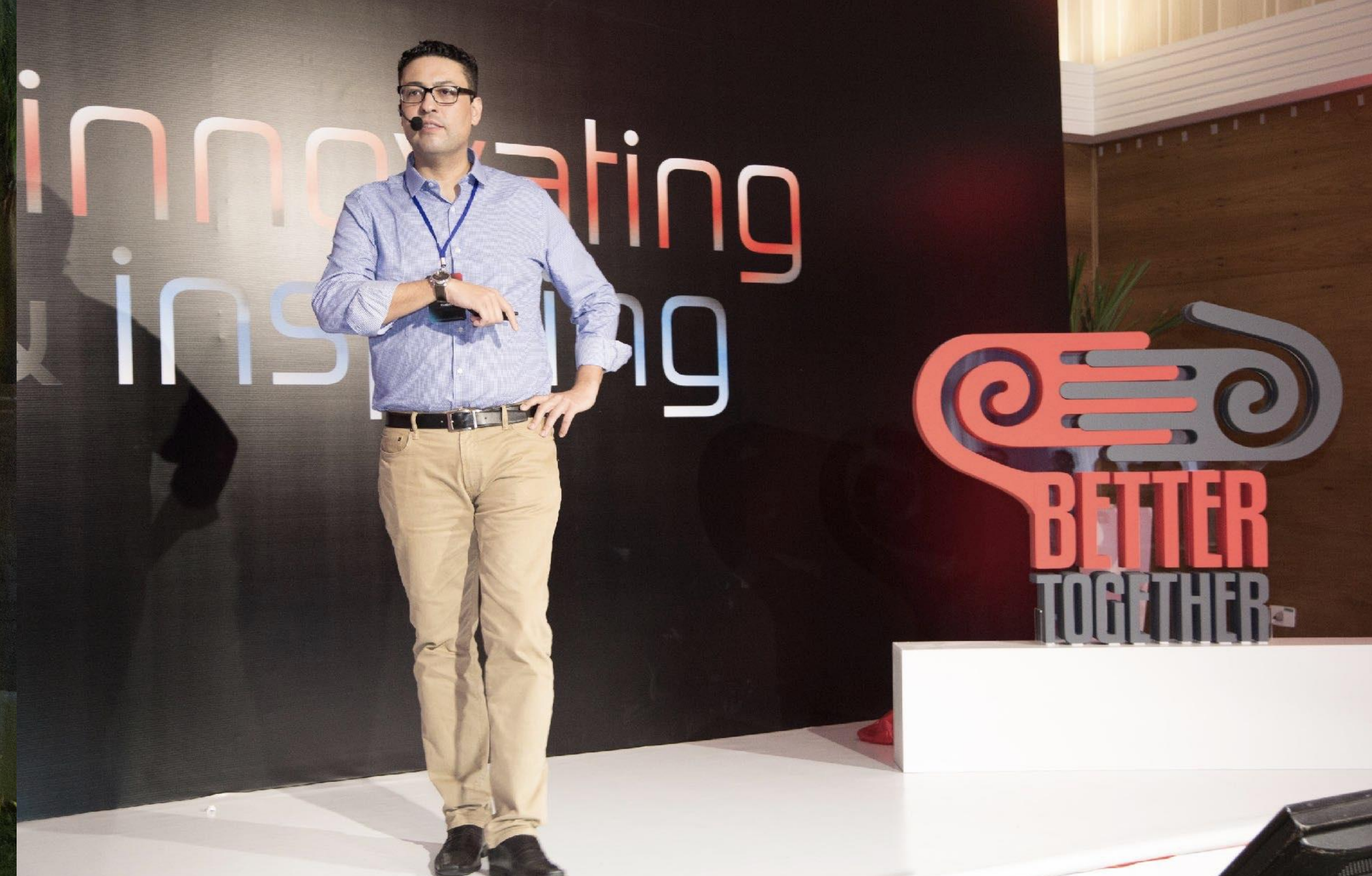
LEICA | KICK OFF MEETING BRASIL 2018