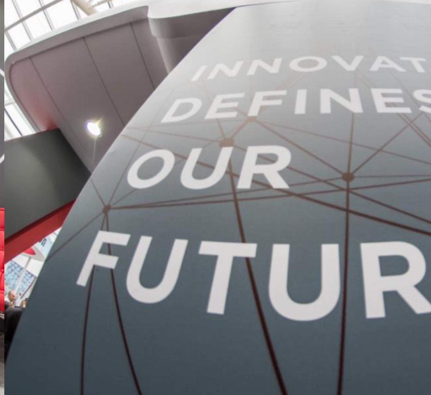
ESTANDE | BECKMAN COULTER